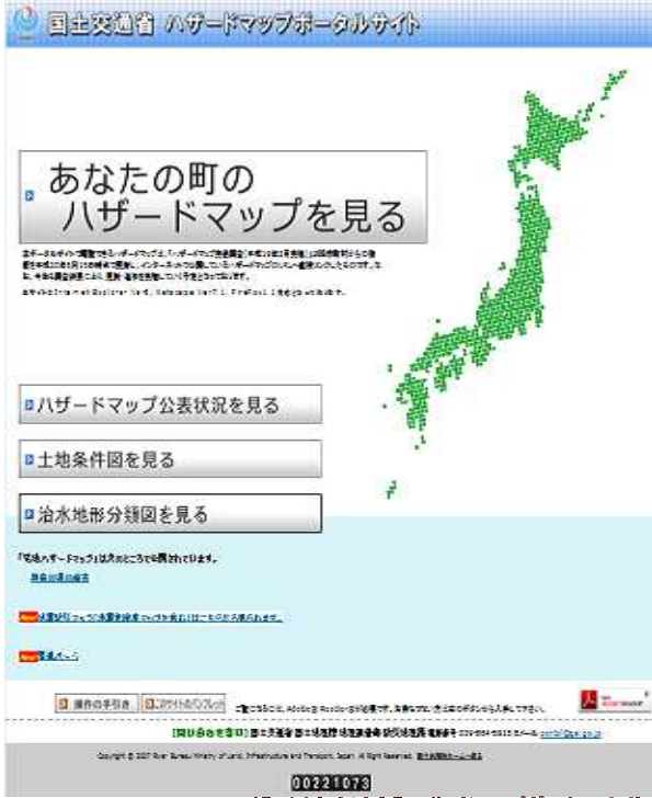
画像：国土交通省「ハザードマップポータルサイト」

アドレスは http://www1.gsi.go.jp/geowww/disapotal/index.html です。